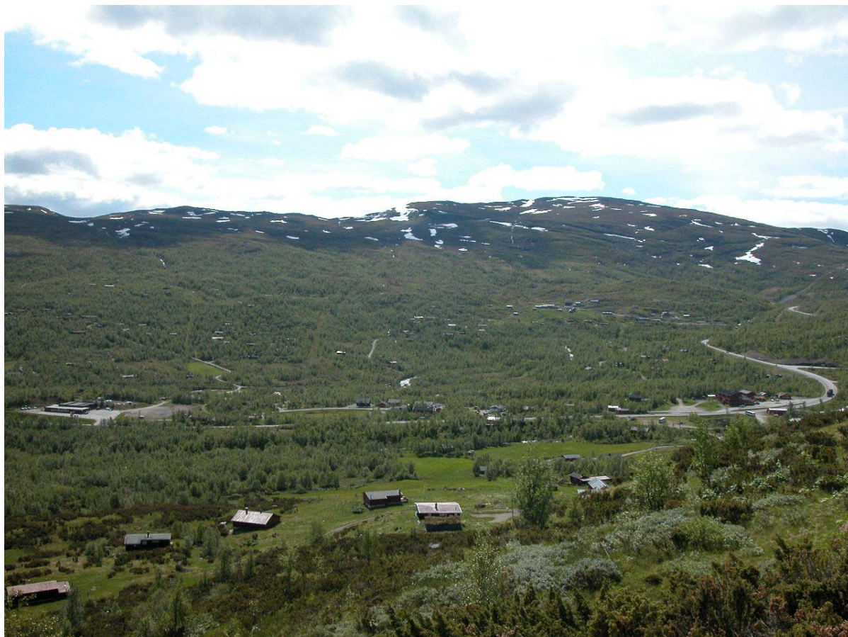
Figur 5. Utformingen av hytter og hyttefelt har stor innvirkning på landskapets karakter. Fra Vang i Valdres (Foto: Bjørn P. Kaltenborn).

Når det gjelder synet på videre utbygging i eksisterende og nye hytteområder i kommunen, er bildet sammensatt. Det er ingen stor oppslutning om, men heller ikke stor motstand mot videre utbygging, dvs. generell tilrettelegging for økt hyttebygging. De fleste mener at fordelene med hytteutbygging er noe større enn ulempene. Dette vises også i spørsmålet om utvidelse av eksisterende felt, hvor de fleste er nøytrale eller svakt negative, og spørsmålet om fortetting av eksisterende hyttefelt, som gjennomgående ikke er ønskelig. Det er også betydelig enighet om utsagnet om at kommunene må være strenge og kritiske når de vurderer nye utbyggingsplaner. Vi ser dessuten en viss skepsis til utbygging av hytter over tregrensen, men denne holdningen er ikke spesielt markant. Hytteeiere i Vang og Vestre Slidre er mer kritiske enn i de to andre områdene. Utvalget er dessuten i liten grad enig i at det bygges for få hytter i Norge, men de fleste er heller ikke sterkt i mot at det utvikles nye hytteområder i kommunen.