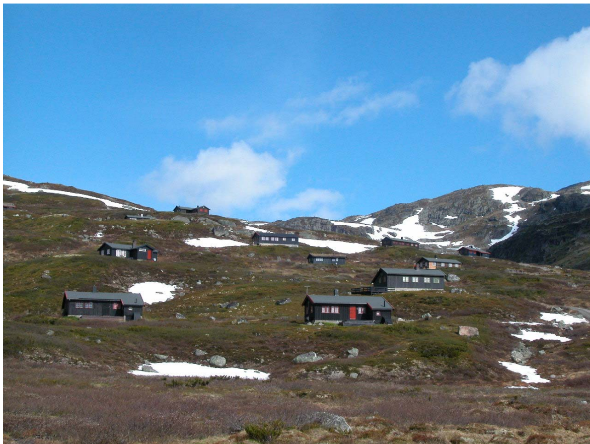
Figur 6. De fleste ønsker at området de har hytte i ikke skal endre seg vesentlig over lang tid.

Vi finner en klar, og kanskje ikke så overraskende trend i dette materialet. Gjennomsnittet i alle hytteområdene vil være langt mer fornøyd med få eller ingen endringer i sine nærmiljøer, enn med moderate eller store endringer. Moderate endringer oppfattes som omlagg midt på treet mellom svært lite ønskelig og svært ønskelig, altså nær en nøytral posisjon (men litt mot den negative delen av skalaen). For store endringer, hvor altså hytteområdet i stor grad skifter karakter, oppfattes som temmelig negativt. Motstanden mot dette er noe mindre blant hytteeiere i Geilo og Hafjell/Kvitfjell, men mønsteret er meget tydelig også her. Samlet sett kan vi anta at de fleste hytteeierne er ganske godt fornøyd med forholdene slik de er nå, og ønsker ideelt sett at området skal forandre seg minst mulig, også på lang sikt. Men ut fra den generelle samfunnsutviklingen og måten hytteområder så langt har utviklet seg, må vi forvente store forandringer i samtlige av studieområdene i denne undersøkelsen i løpet av de kommende par ti-år.