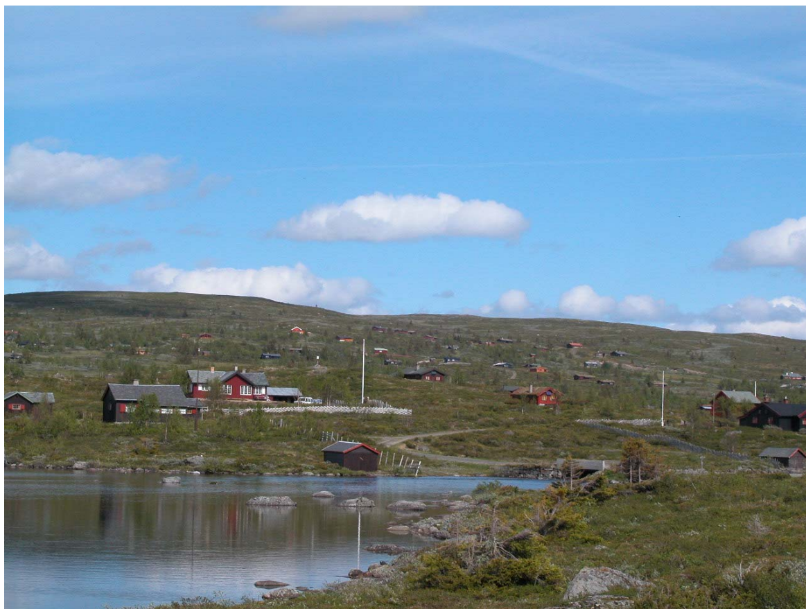
Figur 1. Hytteområdene i fjellheimen er i endring. Her fra området ved Midtre Syndin i Valdres (Foto: Bjørn P. Kaltenborn).