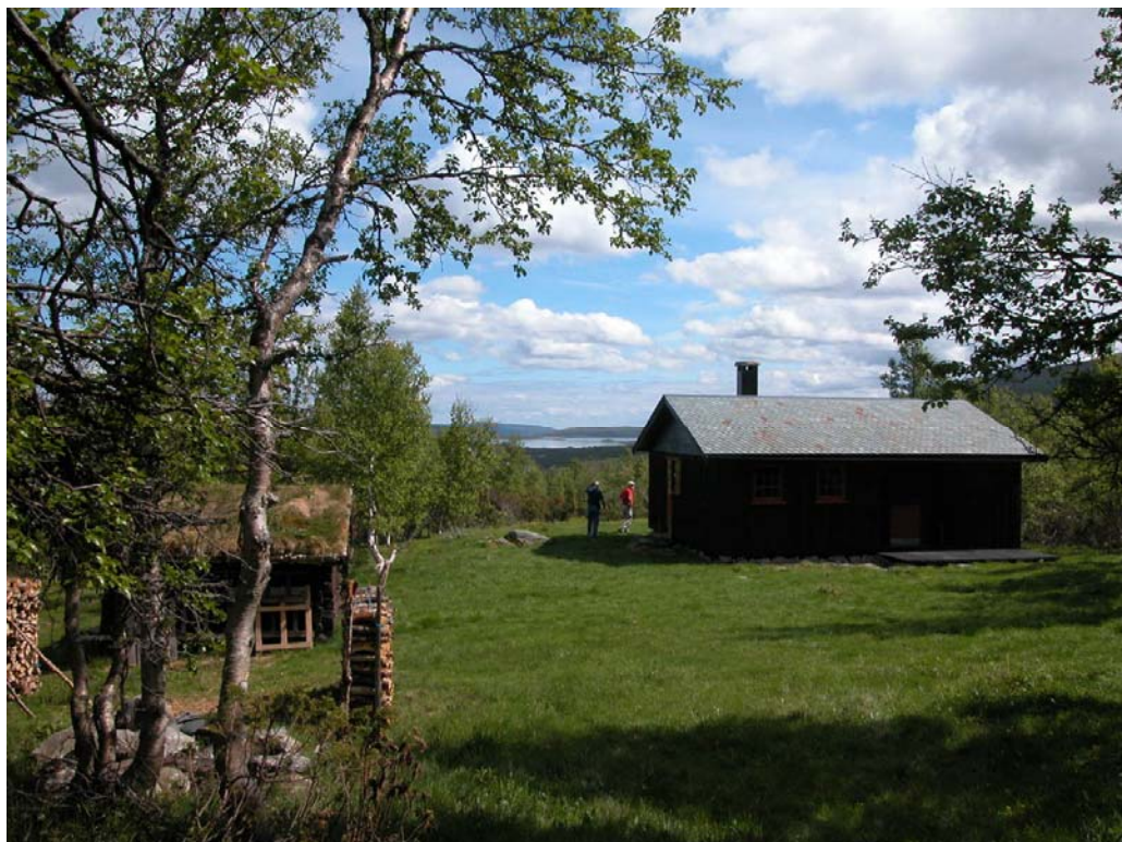
Figur 2. Hytter er viktige i forhold til stedstilknytning. De spiller ofte en rolle i forhold til å kunne bruke naturområder på en spesiell måte og representerer en opplevelsesmessig, sosial og kulturell tilknytning. Fra Vestre Slidre.

Når vi tenker på et sted, f.eks. arbeidsplassen eller hytta, er det ikke bare de fysiske egenskapene, som utseendet, størrelsen eller vegetasjonen omkring som vi ser for oss. Minst like viktig er det at forestillingen vekker visse følelser i oss. Det kan være mange og sammensatte følelser, og de kan variere fra de ubehagelige til de behagelige, eller fra det kjedelige til noe utfordrende og spennende.